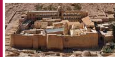
Das St. Katharinen-Kloster im Sinaigebirge. Dort fand Tischendorf Mitte des 19. Jahrh. den Codex Sinaiticus.

Die Präzision der Überlieferung des Bibeltextes durch die Jahrtausende hindurch ist einmalig.